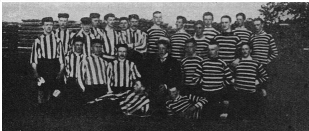
Den første kampen mot Sarpsborg, på bortebane den 10. juli 1904. «Guttane» t. h. i tverrstripede blå og hvite trøyer og sorte benklær

De første årene var preget av pionérånd. Fotball var fortsatt en ung sport i Norge, og det var få motstandere å spille mot. FFK bidro indirekte faktisk til etableringen av rivalen Sarpsborg FK. En engelsk fotballentusiast fikk ikke lov til å trene med laget - han bodde jo i Sarpsborg! Han ble i stedet oppfordret til å starte en klubb i nabobyen. Dermed ble grunnlaget lagt for en av norsk fotballs eldste rivaliseringer . Den første kampen mellom FFK og SFK, ja den første kampen overhode for FFK, ble avholdt i Sarpsborg i juli 1904 - og FFK vant 4-0 .