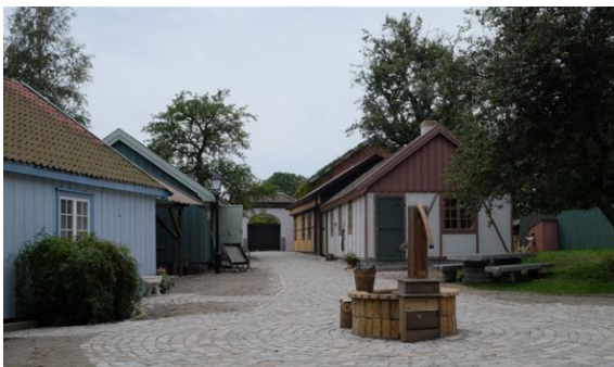
Anno-landsbyen på Isegran

Måneproduksjoner AS har levert utallige scenografioppdrag gjennom årene. Da Anno ble filmet i Fredrikstad, spilte Måneproduksjoner en stor rolle i oppbyggingen av hele Anno-landsbyen.