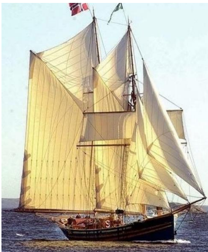
Gaffelskonnerten S/Y Valentine av Fredrikstad for fulle seil